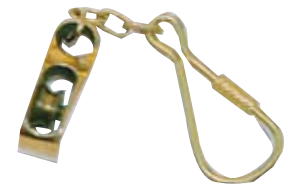
14.14444 Bozzello ottone