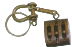
14.14449 Bozzello legno